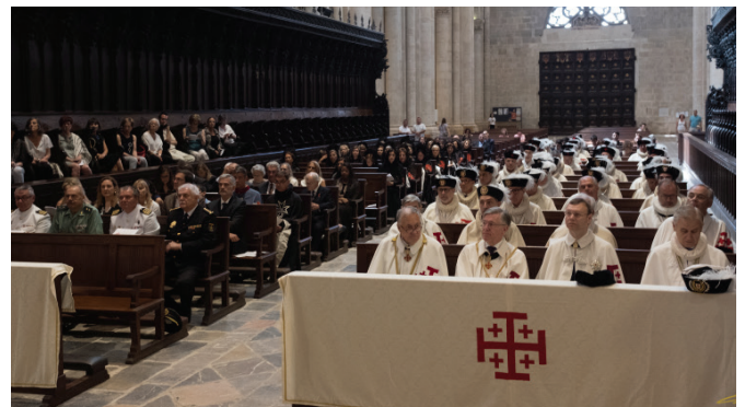
Imagen de la nave central de la Catedral de Tarragona durante la Investidura.