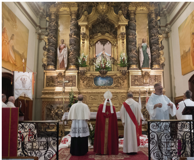
El Cardenal Martínez Sistach homenajando a la Virgen de la Misericordia de Reus durante la Salve Regina.