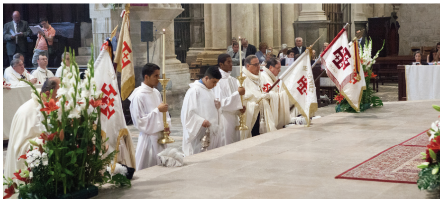
Rindiendo los estandartes durante la consagración en la Catedral de Tarragona.

Este acto es verdaderamente impresionante y apasionante por la simbología empleada, por el texto del Celebrante y las palabras de los Neófitos. Toda la catedral se convierte en fedataria del ingreso de los nuevos miembros en la Orden, como si fuera la Iglesia universal quien acogiera a los nuevos Caballeros y Damas del Santo Sepulcro. Hoy como ayer y, de la misma forma, como se reproducirá en los tiempos venideros. Los Neófitos comprometiéndose ante el Cardenal, tocando con la mano derecha