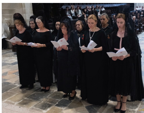
Las Damas Neófitas ante el Altar Mayor en la Catedral de Tarragona.