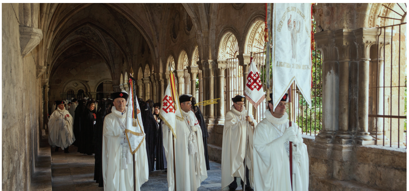
Los estandartes abriendo la comitiva en el claustro de la Catedral de Tarragona.

Seguidamente es procedió a la investidura del Caballero eclesiástico que se arrodilló ante el Cardenal que le