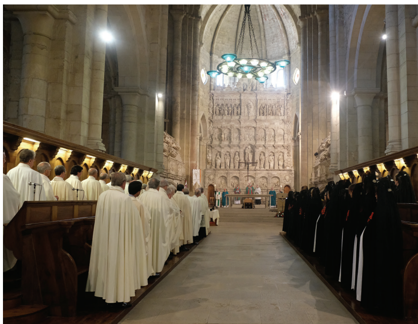
Caballeros y Damas en el Coro del Real Monasterio de Poblet durante la Misa de Acción de Gracias.