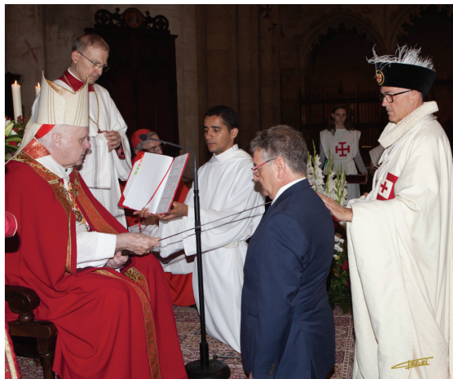
El Cardenal O'Brien en el momento de investir con la espada a un Caballero.