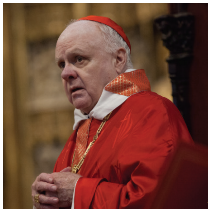
El Cardenal Edwin Frederick O'Brien, Gran Maestro de la OESSJ.

Príncipes de la Iglesia, la implicación sin reservas de los Caballeros y las Damas, de sus familias y de todos los asistentes y, no menos importante y en esta edición de manera extraordinaria, la aportación musical —en este caso a cargo del Ensemble O Vos Omnes—. La investidura del OESSJ de la España Oriental, en los cuatro años precedentes, ha tenido como sede: la Catedral de Zaragoza en 2015, la Catedral de Barcelona en 2016, la Catedral de Valencia en 2017, y la Catedral de Girona en 2018.