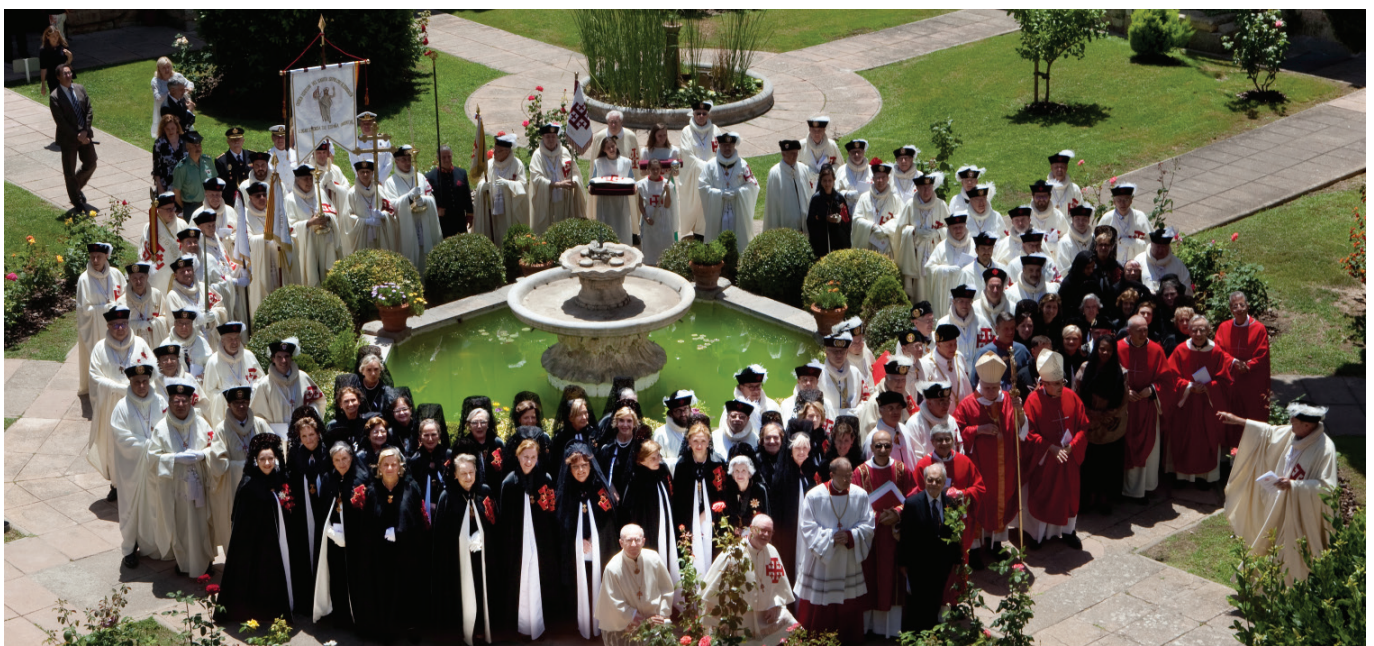
Fotografía de familia en el claustro de la Catedral de Tarragona después de la Investidura.