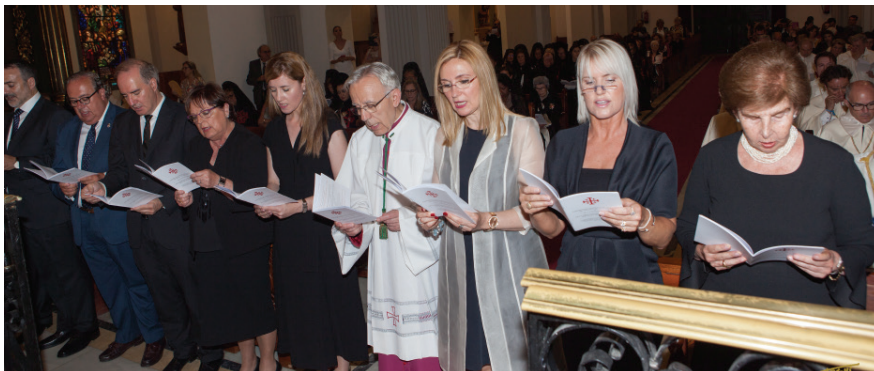
Los Caballeros y las Damas Neófitos leyendo la fórmula de Promesa.