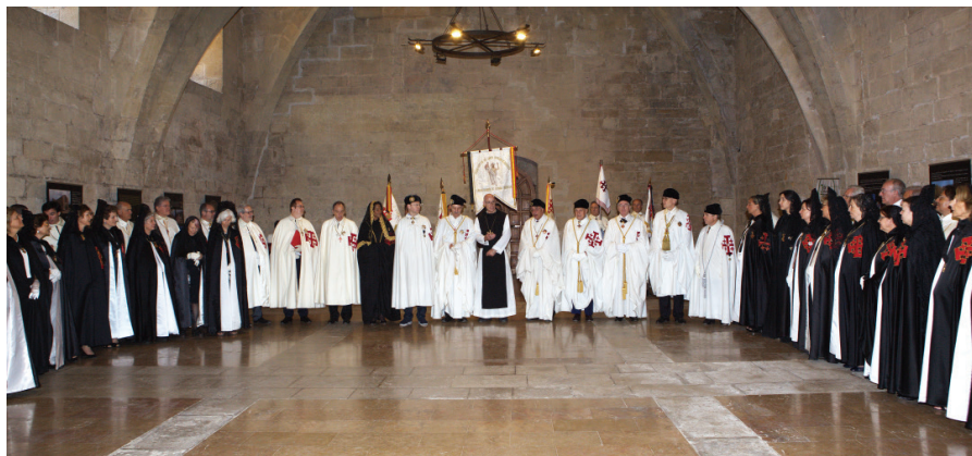
Recepción del Padre Abad de Poblet, Dr. Octavi Vilà a la OESSJ.

La visita a Poblet adquirió la condición de evento memorable por la trascendencia que supuso descubrir en algunos casos o reencontrarse en otros, con este cenobio cisterciense del 1150, a los pies de las Montañas de Prades, un verdadero símbolo para Cataluña y Aragón, panteón real de los soberanos de la Corona de Aragón, desde el reinado de Pedro el Ceremonioso y en el transcurso de los siglos XIV y XV, uno de los monasterios más importantes del Viejo