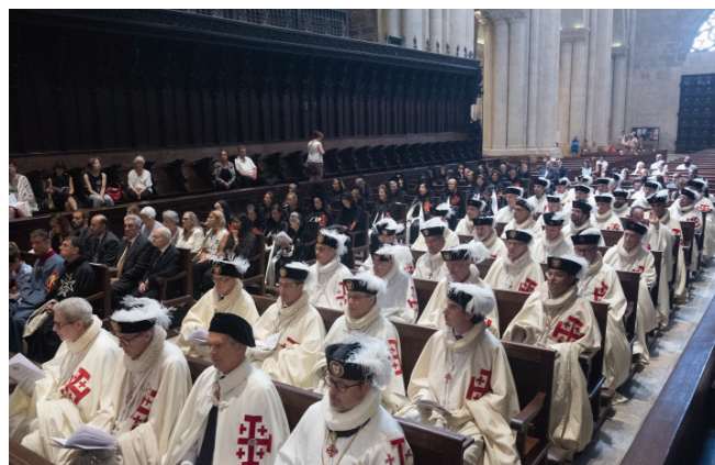
Imagen de la nave de la Catedral de Tarragona durante la Investidura con los Caballeros y Damas.