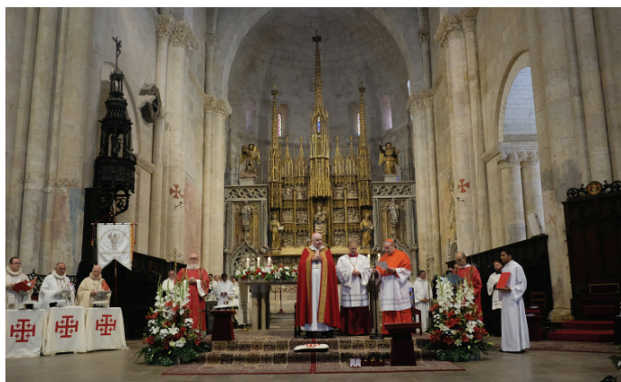
El Cardenal O'Brien presidiendo la Investidura en la Catedral de Tarragona.