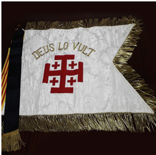
Anverso del Estandarte de la Delegación Local de Tarragona de la OESSJ.