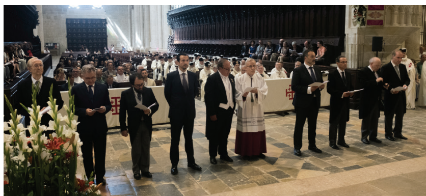
© Foto: FER-VI. Los Caballeros Neófitas ante el Altar Mayor en la Catedral de Tarragona.

la Misericordia y con el ferviente deseo de orar, se entraba en el Santuario mariano y se iniciaba la Vela de Armas, con los Neófitos presentando su hábito para ser bendecido y depositándolo a los pies del altar, como en un jardín de cruces quíntuples que ya, para siempre, serán la brújula y la razón de ser de los nuevos Caballeros y Damas.